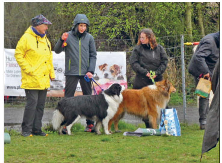
Team Schönfeld II auf dem 3. Platz