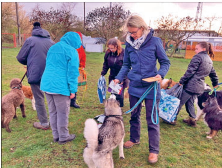
Aufteilung der „Mannschaftsbeute“